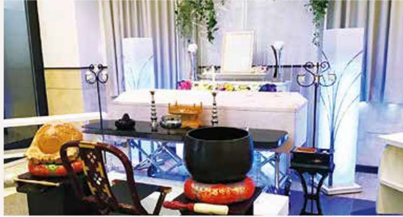
祭壇 ※写真はイメージです