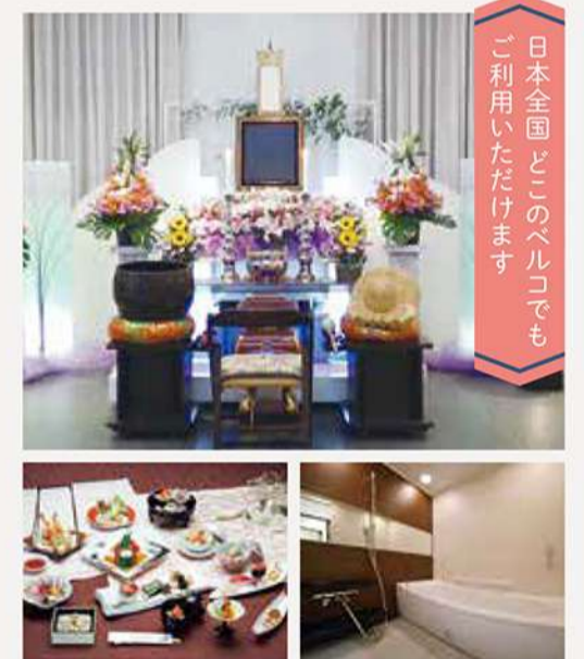
充実した設備で快適にお過ごしいただけます

ベルコ互助会は 日本全国約 2,400万 人の 会員様に支えられる 安心のネットワークです